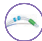
Typ Smart Cut