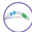
Typ Smart Cut